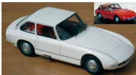
Nordland Scale 43, skala 1:43 Material: Resin