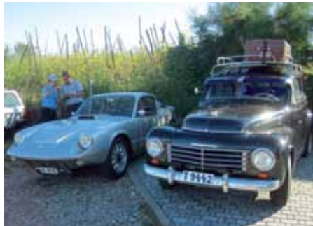
Sonett II -67 och PV 444 -53 med Magnus och Flavio i bakgrunden.

Sammanlagt blev det en resa på 75 mil och jag vet nu att Sonettens lilla bagage rymmer åtminstone 6 kartonger vin med 6 flaskor vardera.