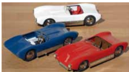
Tin Wizard, skala 1:43 Material: Vitmetall