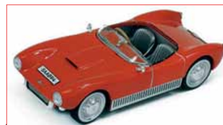
Premium X, skala 1:43 Material: Metall

Premium X-modellerna utvecklas av Premium & Collectibles Trading Co. Ltd. i Kina. Det är fina modeller; olika versioner och färger av samma modell kan också tillverkas under andra varunamn som Triple 9 och Whitebox. Samma tillverkare producerar också modellerna till Editions Atlas "Saab Car Museum Collection". Den här röda I:an kom i september 2015.