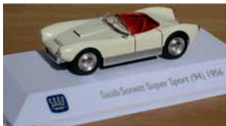
Editions Atlas, skala 1:43 Material: Resin

I början av år 2014 kom ett erbjudande från Editions Atlas om att man