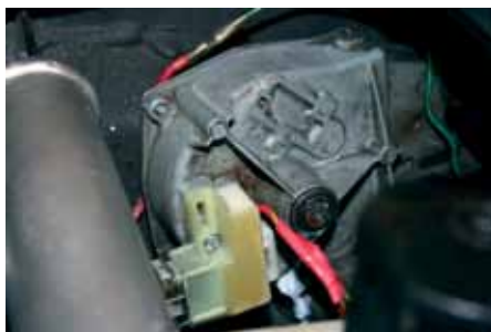
Kontakten som styr parkeringsläget på tor-karmotorn.