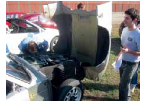
Nyfiket studium av Sonettmotorn.

lig "cruising" i det vackra och böljande landskapet där vinskörden pågick för fullt.