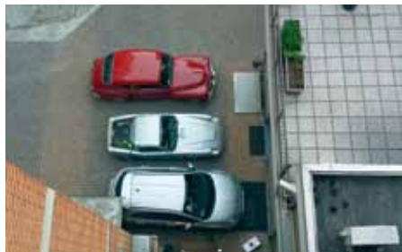
Utsikt från hotell Italia i Stradella, Lombardia.