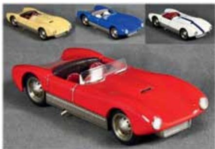
Beny Box, skala 1:43 Material: Vitmetall