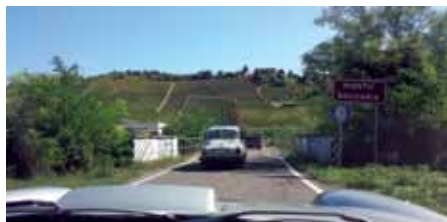
Scenic Tour Montu' Beccaria bakom Flavio Campetti's Saab 96 V4.