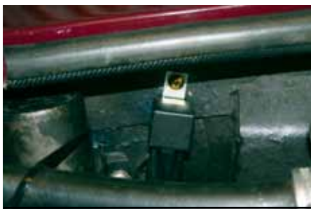
Reläets placering på höger sida bakom tändspolen.