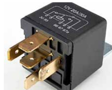
Biltema stegrelä nr 42303.

Kopplingsschemat är från ett färglagat kopplingsschema till Sonett III