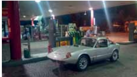
Stopp för tankning, A 21 mellan Torino och Piacenza.

Enthusiasts) som co-pilot på resan. Vi startade redan under lördagen den 19 september nedresan via Grand St Bernard – tunneln i riktning ner mot Turin och sedan österut i riktning mot Piacenza.