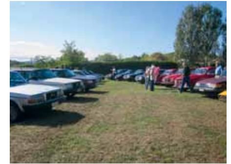
Saab- och Volvoparkering vid Giorgio, Oltrepó Pavese.