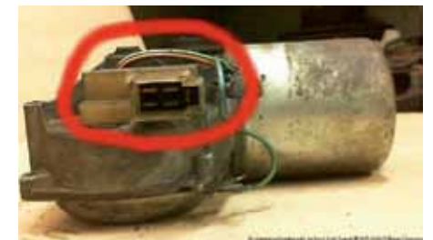
Givare parkeringsläge på torkarmotorn.

T v. Kopplingsschema torkarmotor (14) och stegrelä (11).