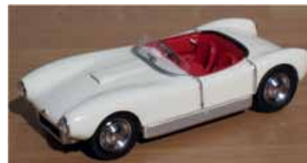
Norev - Provence Moulage, skala 1:43 Material: Resin

Norev startade år 1946 i Frankrike, tillverkade i början mest leksaker. För några år sen tog man över ett annat franskt märke, Provence Moulage och tillverkar numera också fina samlar-modeller som den här Sonett I:an.