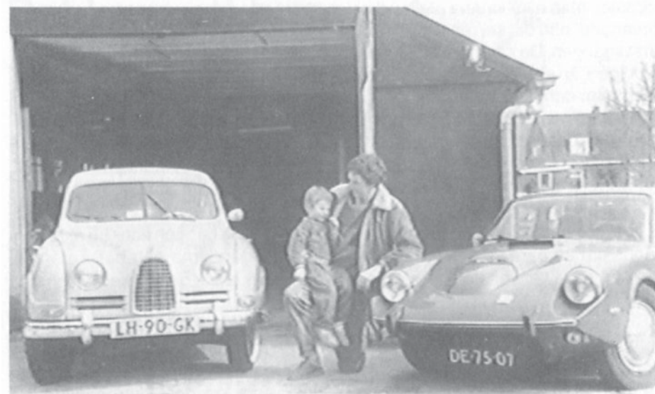
Till vänster Saab 93 från 1956, till höger Sonetten med chassinummer 1372, i mitten far och son de Vries.