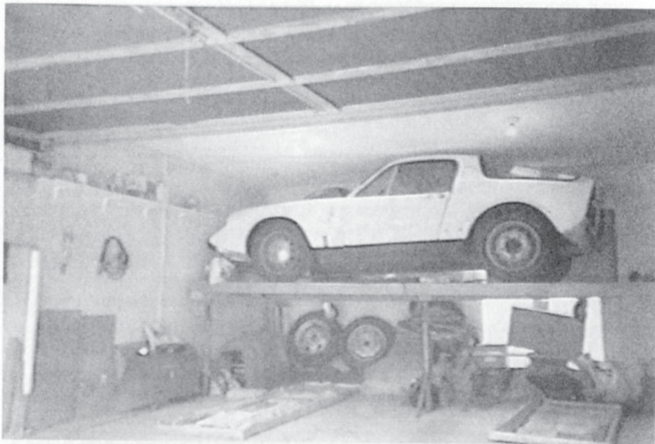
Typisk garagebild på Sonett. Det verkar vara gott om plats för renoveringen så småningom.

till det nuvarande hemmet. Bilen gick, men var i ett dåligt skick. För att få bilen i farbart skick måste den renoveras helt, men det lönar sig förstås. Kilometerräknaren stod på 128000; historiken för bilen och dess tidigare ägare var dock obekannt. Innan Sonetten renoveras måste dock en 96 V4 från 1973 sättas ihop igen. Renoveringen av Sonetten kommer garanterat att äga rum, men sannolikt inte inom kort.