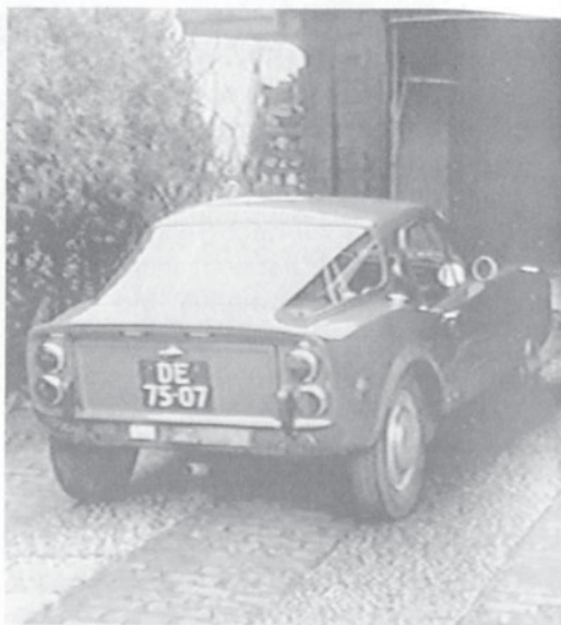
Baksidan på min Sonett.

Kära Sonettvänner. Vad sägs om en artikel om Sonetten från Nederländerna? Ja, det är möjligt!