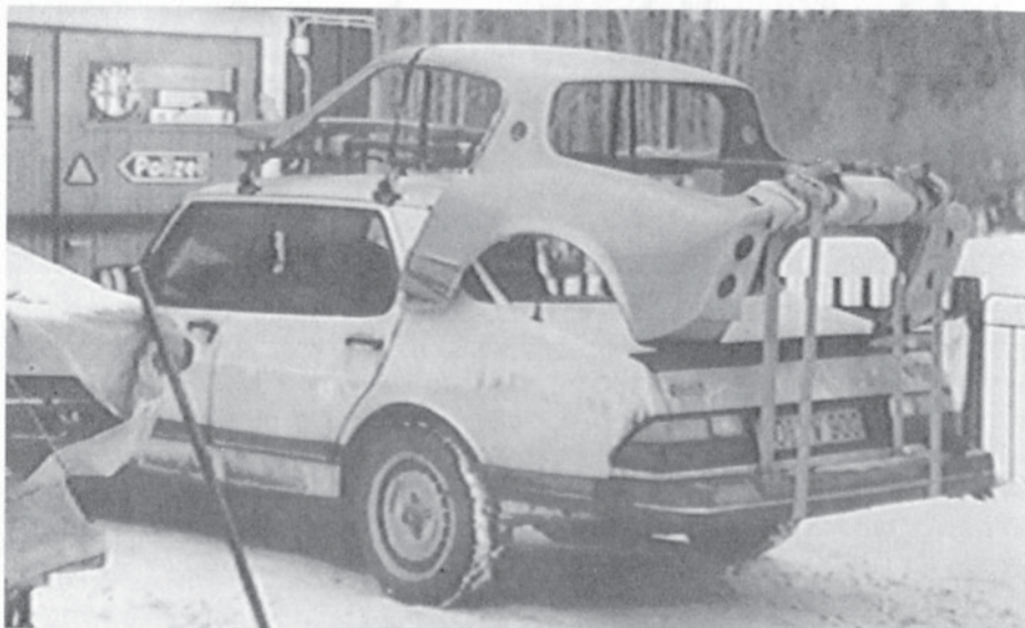
Är det så här som nya Saabar kommer till?!